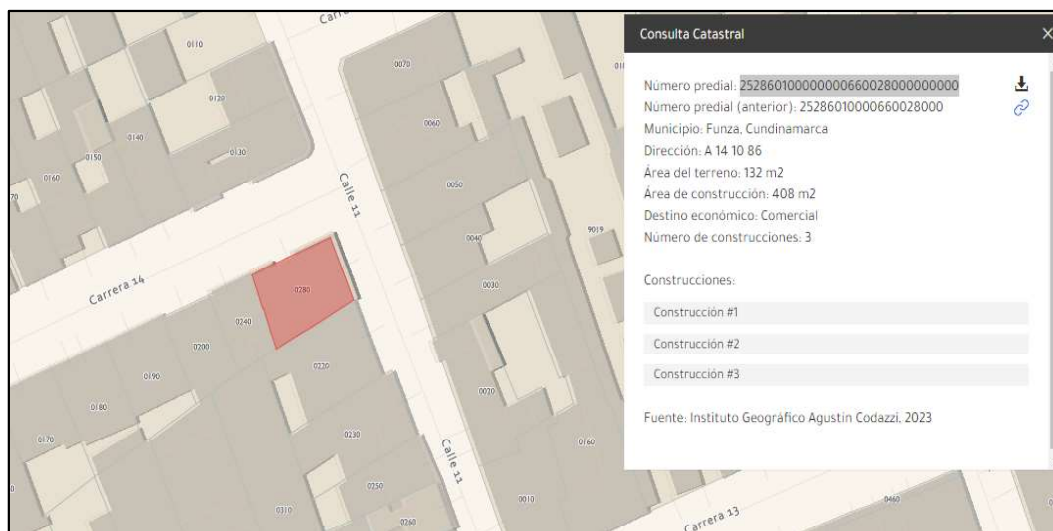
Ilustración 3. Consulta Catastral

El establecimiento comercial denominado “Consultorio Alexandra Correa diseño de sonrisa” se encuentra identificado con cedula catastral 252860100000000660028000000000, de conformidad con la consulta realizada en el geoportal del Instituto Geográfico Agustín Codazzi IGAC (ver ilustración 3).