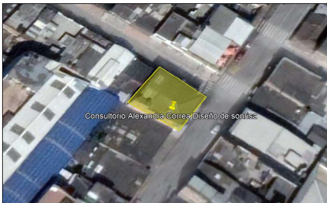
Ilustración 1. Ubicación predio

Teniendo en cuenta que ante el municipio de Funza se interpuso queja por lavado de andenes por parte del establecimiento comercial consultorio “Alexandra Correa diseño de sonrisa”, el día 19 de abril personal adscrito a la Secretaría de Ambiente y Bienestar Animal realizó inspección, de conformidad con el acta de visita ambiental No. 051, en el predio ubicado en la dirección calle 11 No 13 -47 barrio la Chaguya (ver ilustración 1. polígono amarillo), coordenadas 4°42'57.033" N y 74°12'50.646" W, como se muestra en la ilustración 2: